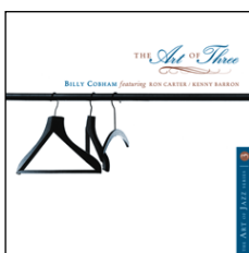
IOR CD 77045-2 Billy Cobham The Art Of Three